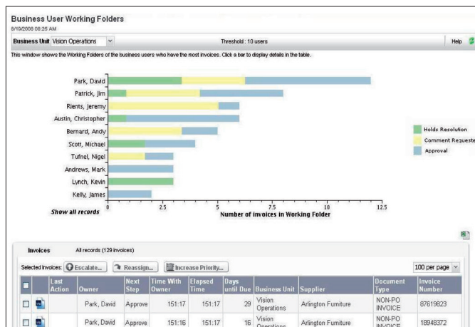
Trabalho em Progresso Fora da AP

O Kofax MarkView AP Advisor permite que as organizações financeiras melhorem os níveis de serviço e a qualidade ao estabelecer padrões de desempenho e alavancar as informações valiosas de desempenho do processo. A percepção dos problemas de desempenho do processo e o acesso a informações de forma oportuna são essenciais para gerenciar os custos e a produtividade